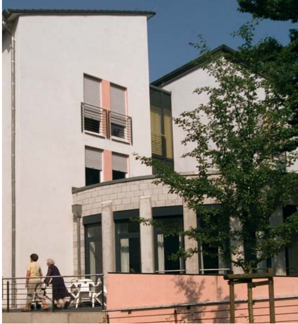
Haus Elisabeth. Warme Menschlichkeit.